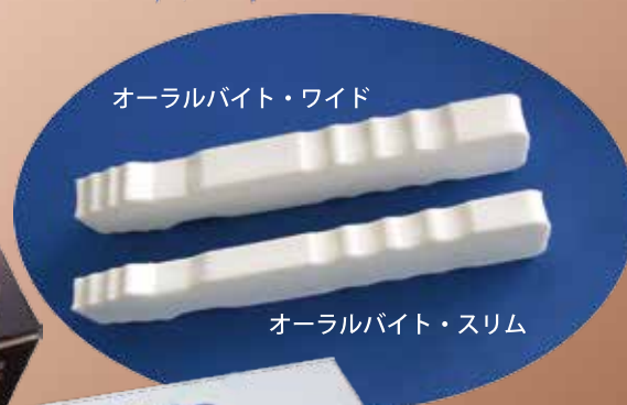
オーラルバイト・ワイド