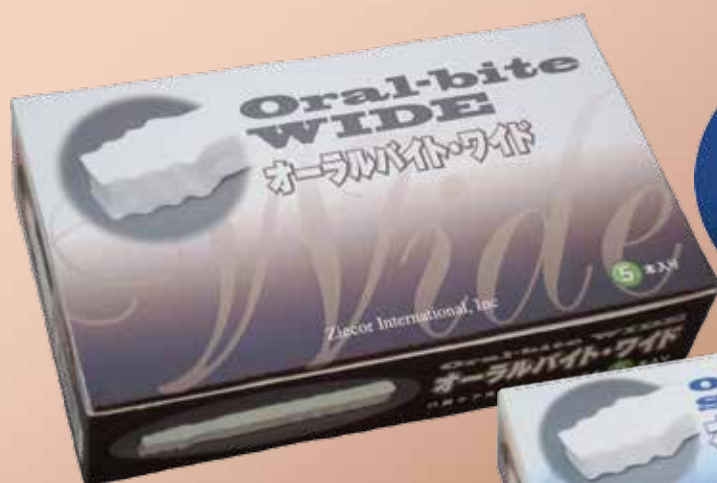
● オーラルバイト・ワイド